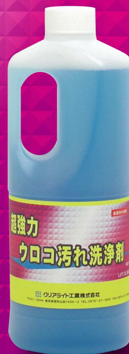
容量：1 kg ポリ容器