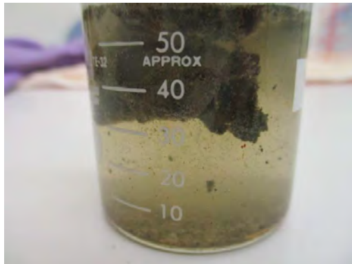
[10分後 スライム分解反応]