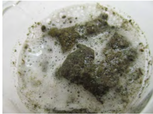
[20分後 分解促進反応]