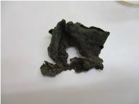
[ドレンパンに付着したスライム]