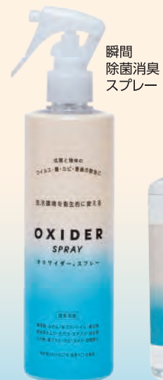
瞬間 除菌消臭 スプレー

使用済オムツ・ペットの排泄物・生ゴミ・腐敗物・トイレ・エアコンフィルター・灰皿等や、ニオイが気になる空間内に噴霧する。 ※木や花など天然の香り、ゴムなど素材のニオイは消えません。