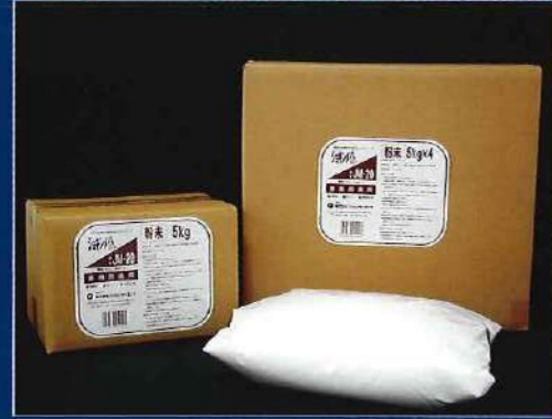
品名: ジョキンメイト (5kg袋×4)

【成分】炭酸塩、過炭酸塩、グルコン酸塩、有機キレート剤、植物性消臭カプセル、ヤシから抽出した天然脂肪酸(非イオン系界面活性剤) 【外観】白色粉末