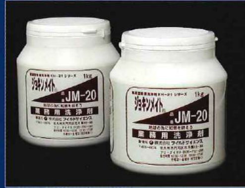
品名: ジョキンメイト (1kgボトル×6) 付属: 計量スプーン