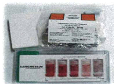
【簡易二酸化塩素濃度測定キット】